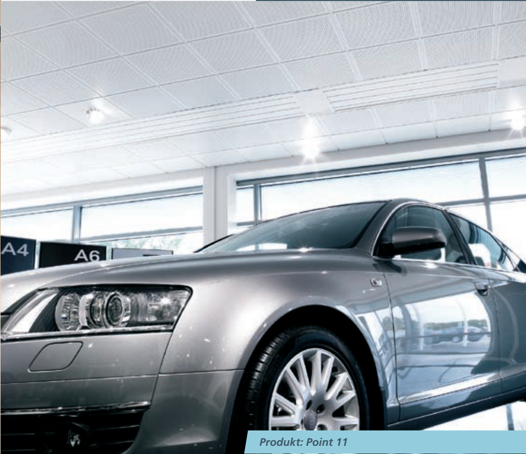
Produkt: Point 11