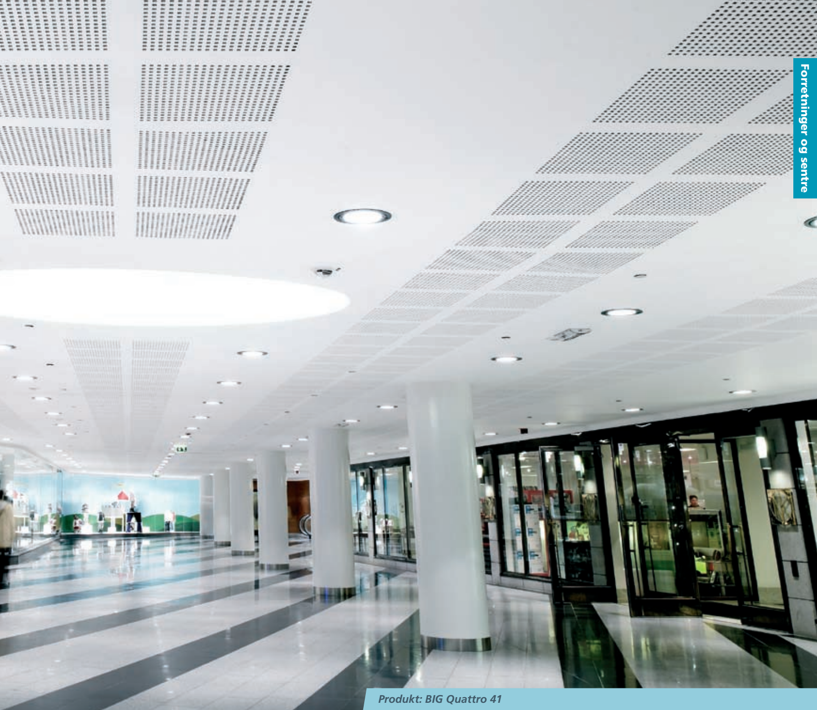
Produkt: BIG Quattro 41