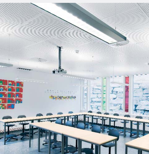
Undervisningslokalene oppfyller de nye akustikkkravene.